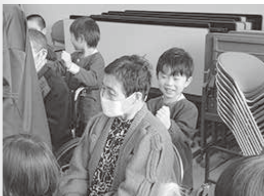
トントン肩たたき！ず～っと元気でいてね。