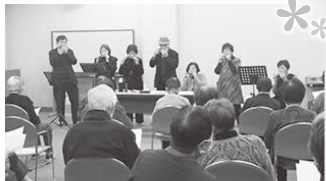
昭和の名曲の演奏に合わせて歌いました。肺機能の維持が図られます。