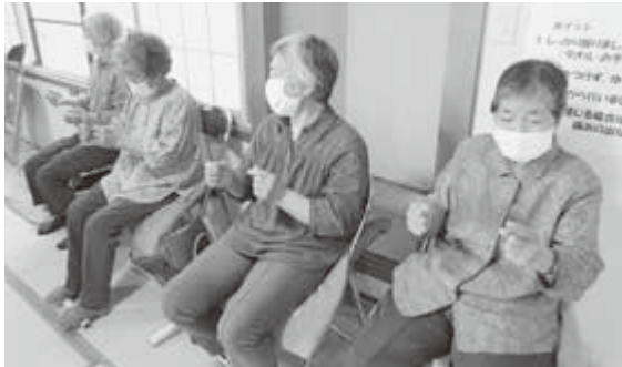
オリジナル指体操で脳トレしています！

「農業・自営業等で現役世代の方も多い地区ですが、若いうちから参加してくれたら嬉しいです。コロナで交流が少ない時期だからこそ、皆さんの参加を待ってます。」と話してくださいました。