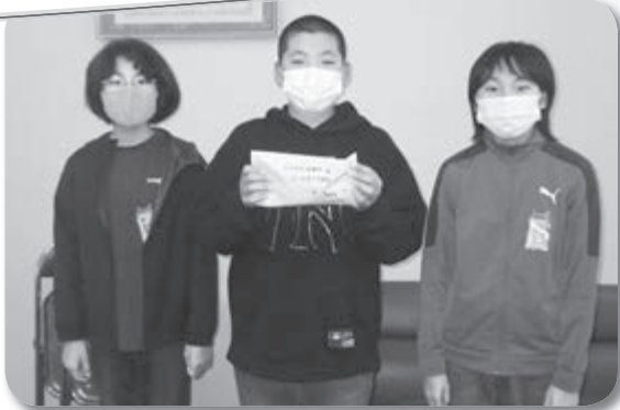
赤い羽根共同募金