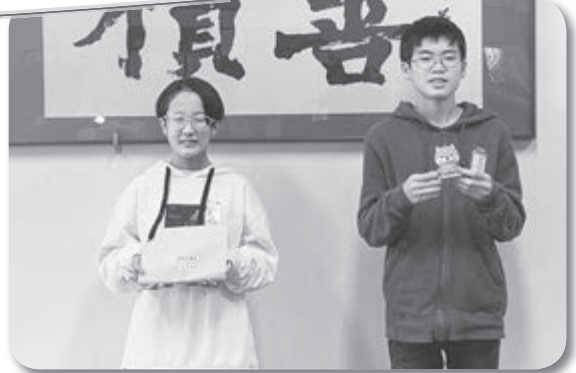
赤い羽根共同募金