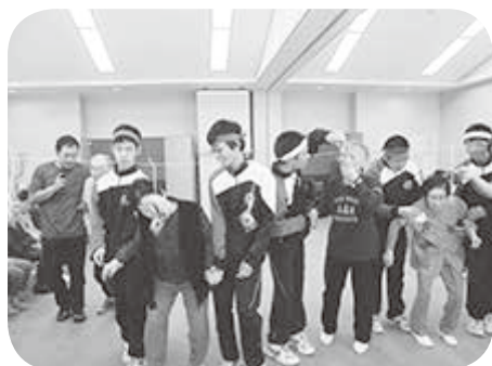
山本中学校 山本デイサービスでの交流