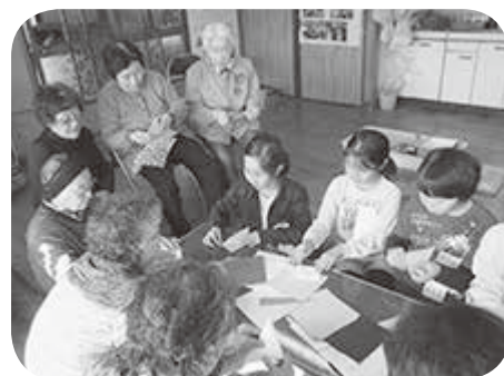
金岡小学校 地域のサロンと交流