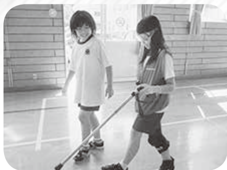
下岩川小学校 疑似体験

高齢者や障がい者の方々との交流や体験学習を通じて、思いやりを持つことやお互いに助け合うことの大切さを感じ、子どもたち自身がこの町で暮らす一人として、できることは何かを考え、行動するための力を育むきっかけ作りとなりました。