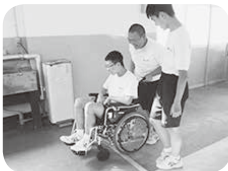
琴丘中学校 車イスについて学習