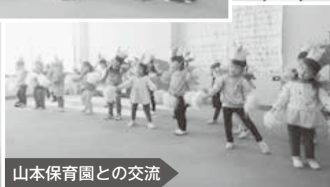
山本保育園との交流