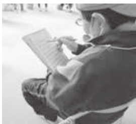
グリットエクササイズ（脳トレ） 集中力が重要です