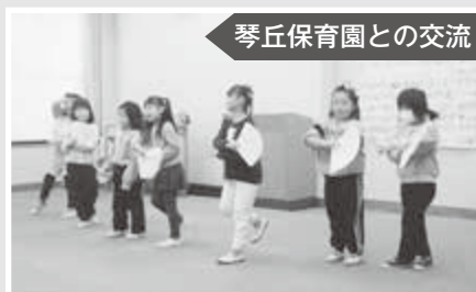
琴丘保育園との交流

今年も、地域の方々の協力を得て12月のお楽しみ交流会を三種町地域福祉センターにて開催しました。長信田の森の生徒さんとの交流会、保育園児によるお遊戯の披露、職員によるお楽しみ会、最終日はみたねベンベンYHKによる軽快なトークとスコップ三味線で、笑いと感動をプレゼントしていただきました。どの時間も笑顔が絶えず、最高のお楽しみ交流会になりました。