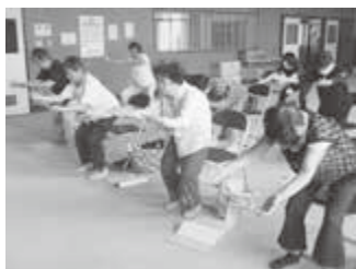
スクワットで足腰の筋力アップ！！